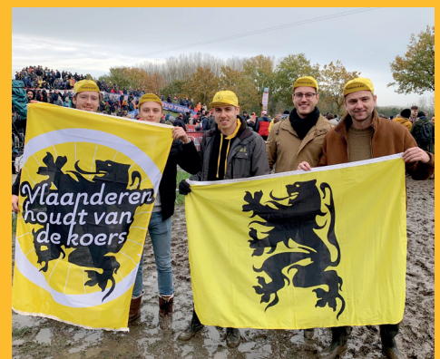
Bevlaggingsactie van Jong N-VA tijdens het veldrijden in Dendermonde

Spreken die standpunten u aan? Kom vrijblijvend kennis maken met de leden van Jong N-VA Buggenhout. Neem contact op via jonathan.goossens@n-va.be