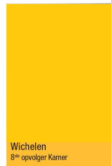
Wichelen 8 ste opvolger Kamer