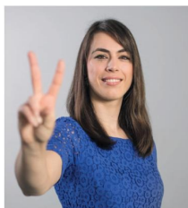
An Vervliet Lebbeke 15 de plaats Vlaams Parlement