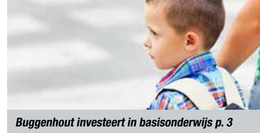
Buggenhout investeert in basisonderwijs p. 3