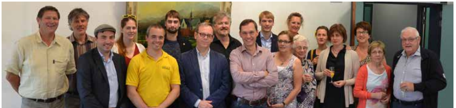
▲ N-VA-sympathisanten verwelkomen Peter De Roover (7 de van links) in Buggenhout.

hun Nederlandstalige liedjes het publiek op hun hand. Tijdens de academische zitting genoten we van de speech van Peter De Roover (N-VA-fractieleider in het federaal parlement). Hij legde uit dat de grens tussen Vlaanderen en Wallonië niet enkel geografisch van aard is, maar ook sociologisch. Zo zijn Nathalie Meskens en Etienne Vermeersch onbekend in Wallonië terwijl ze hier het publieke debat kleuren. Daarnaast bewijzen vriendschappen op sociale media en telefooncontacten dat de taalgrens een echte communicatieve barrière is. Deze barrière is historisch gegroeid en creëert twee verschillende publieke opinies, twee culturele identiteiten en twee democratieën. De volle raadszaal smaakte deze duidelijke schets.