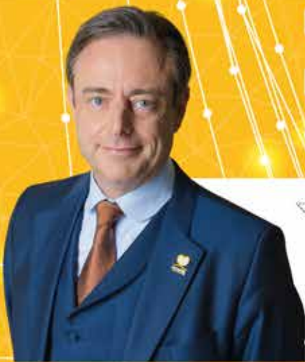
Bart De Wever Algemeen voorzitter

Engie passeert tweemaal langs de kassa. Door het uitstelgedrag van paars-groen kan het energiebedrijf extra veel geld vragen om de kerncentrales te verlengen. En daarbovenop ontvangt Engie van de regering ook nog eens gassubsidies. De belastingbetaler betaalt het gelag.