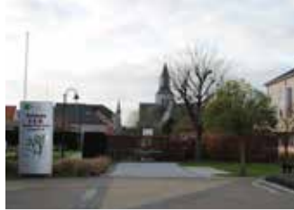
Vernieuwingen woonzorgcentrum p.3