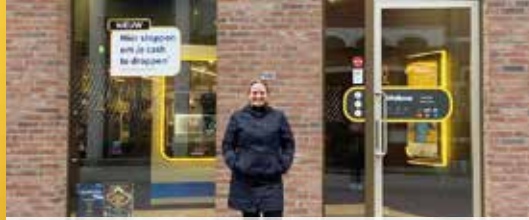
Waar haalt u uw geld af? (p.3)