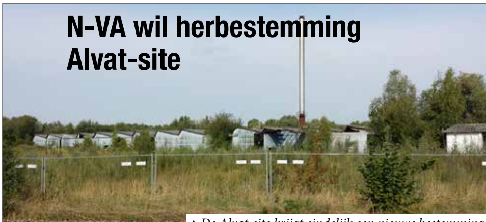
▲ De Alvat-site krijgt eindelijk een nieuwe bestemming.

Al ruim een decennium ligt de Alvat-site (gekend als vatenkot) er verlaten bij. Een meningsverschil tussen het provinciebestuur en het gemeentebestuur over de toekomst van de Alvat-site blokkeerde tot op heden het dossier. Er wordt nu een masterplan opgesteld waarbij onderzocht wordt welke invulling meest geschikt is voor de site. Deze