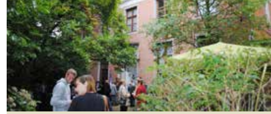
Pastorij in centrum wordt duur project zonder functie (p. 3)