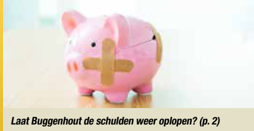
Laat Buggenhout de schulden weer oplopen? (p. 2)